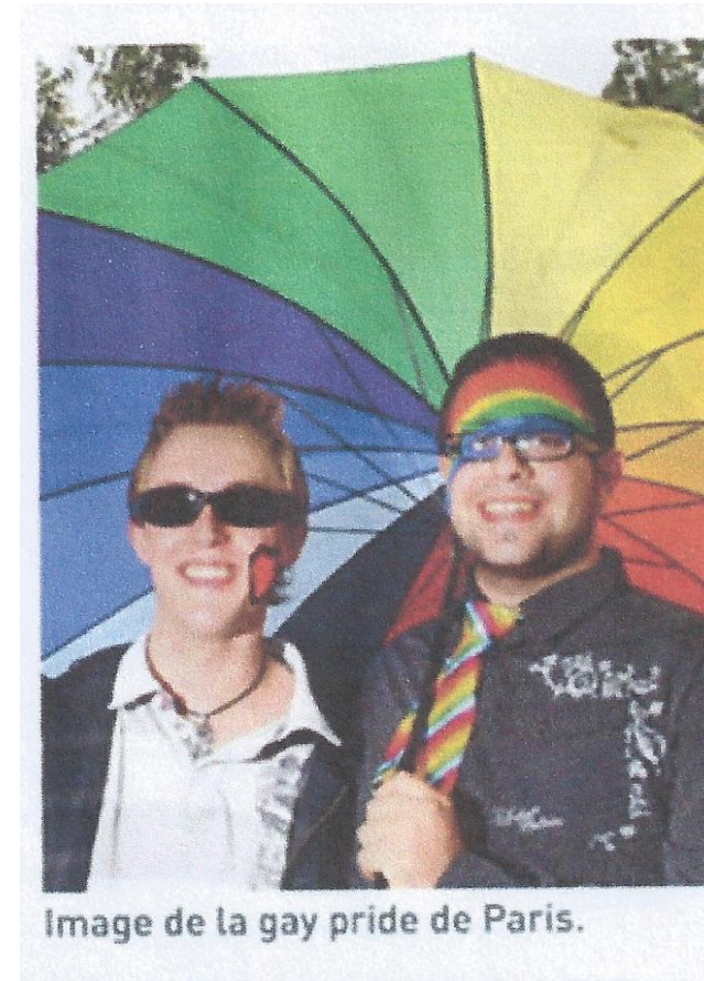
Image de la gay pride de Paris.

« Le genre, une construction sociale variable qui influe sur la répartition des rôles masculins et féminins »